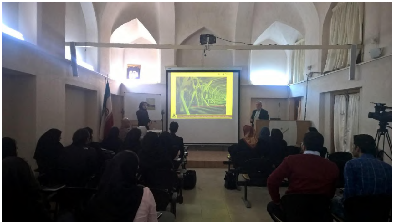
نشست ۳۱: رویکردهای نوین تحلیل و پایش سازه های تاریخی و معاصر (کمیته اسکارسا، ۸ اسفند ۱۳۹۷)