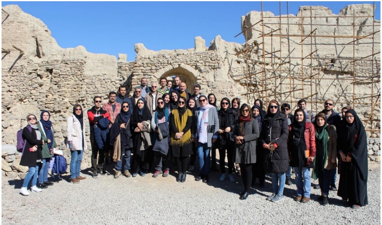
کارگاه یک روزه مستندسازی و شناسایی اماکن و منظر فرهنگی-تاریخی (ایزدخواست، ۱۴ آذر ۱۳۹۸)

به یاد می آوریم که اغلب مؤسسات علمی، دانشکده ها و انستیتوهای معتبر دنیا، دارای نشست های علمی-پژوهشی ویژه در زمینه های تخصصی خود هستند که سابقه برخی از آنها گهگاه از نیم قرن نیز فراتر می رود. چنین زیرساخت های علمی و پژوهشی، علاوه بر کمک به توسعه و تولید علم، بر اعتبار علمی مؤسسه میزبان نیز افزوده است. امیدواریم که این سلسله نشست های علمی-پژوهشی دانشکده که با استقبال گرم و بسیار خوب دانشجویان و اعضای هیأت علمی همراه بوده است، گامی در جهت بهره‌مندی، پیشرفت و تعالی خانواده کوچک دانشگاه هنر اصفهان بوده باشد و روزگاری را شاهد باشیم که این سلسله نشست ها، با همکاری، همراهی و همفکری نسل های مختلف اساتید، دانشجویان، مدیران و کارکنان؛ غنی تر و پر بارتر تداوم یابد و به سابقه‌ایی ۵۰ ساله دست پیدا کند. آنگاه است که می توانیم به چنین زیرساخت علمی-پژوهشی در زمینه حفظ میراث فرهنگی کشور عزیزمان، با غرور افتخار کنیم و شاهد به بار نشستن نسلی آگاه، کار آزموده و مسئول باشیم. لیست نشست ها و کارگاه های برگزار شده در طی این دو سال گذشته، در جدول زیر ارائه گردیده و سعی شده است تا تمام این برنامه ها به طور کامل مستندسازی شود و نسخه تصویری آن، در کتابخانه دانشکده حفاظت و مرمت به منظور استفاده های آتی دانشجویان نگهداری گردد.